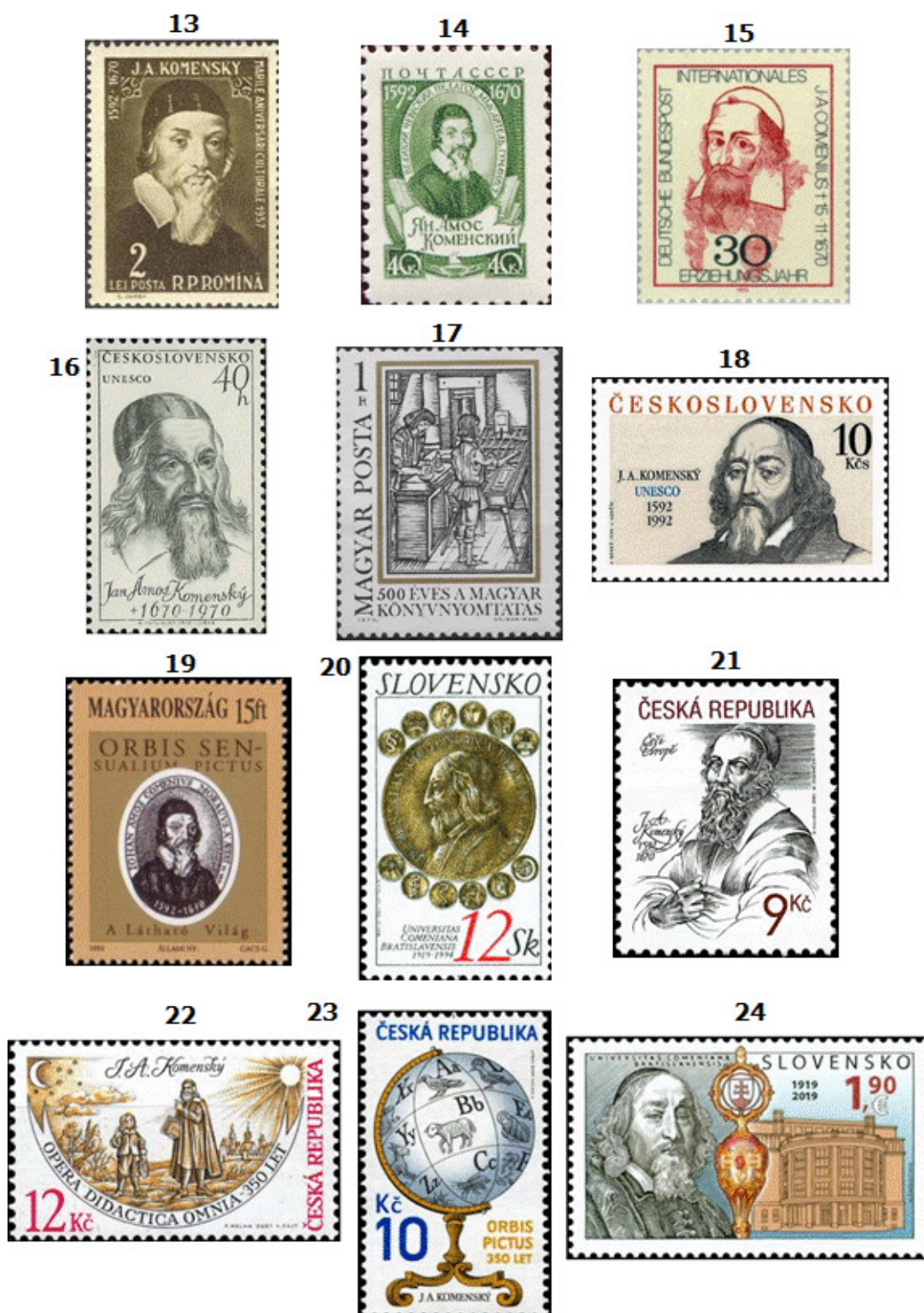
Figura 2. Sellos postales relacionados con Comenio.