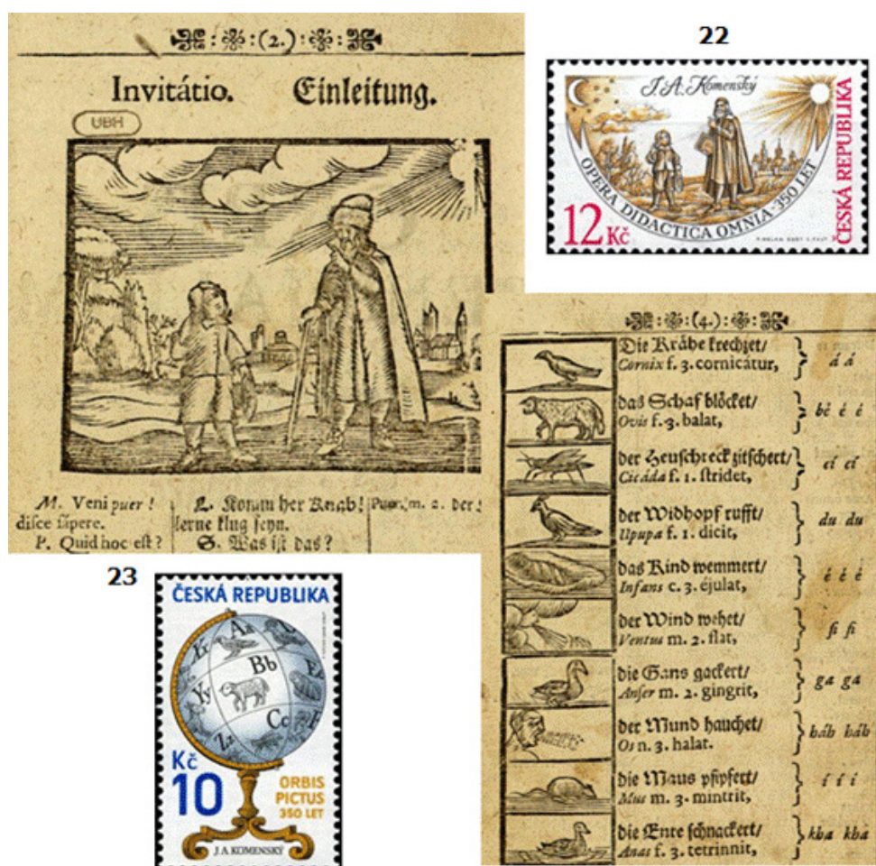
Figura 5. Filatelia y Orbis sensualium pictus.

escritura-dibujo, es un aporte comeniano. El Alfabeto es representado por el sello 23, al respecto Aguirre-Lora (2001a) escribe: “ El mundo en imágenes , introduce una novedad para aprender a leer: un alfabeto...que el autor en unas ocasiones lo llama «alfabeto simbólico» y, en otras, «alfabeto vivo» (p.78).