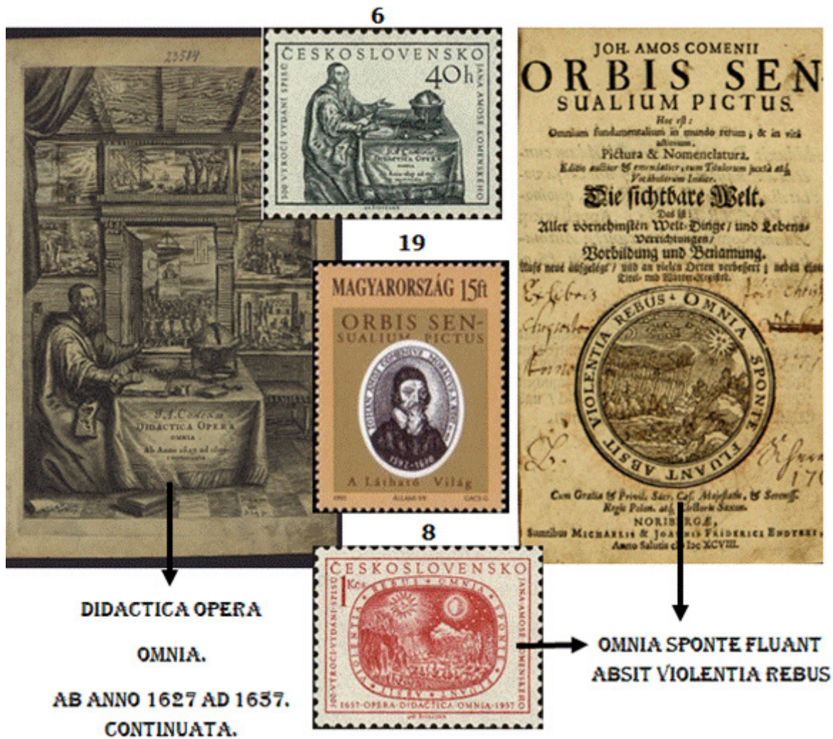
Figura 4. Filatelia, Opera didactica omnia y Orbis sensualium pictus .

El mundo en imágenes se organiza en ciento cincuenta y dos capítulos que dan cuenta de la organización del conocimiento y de la percepción de